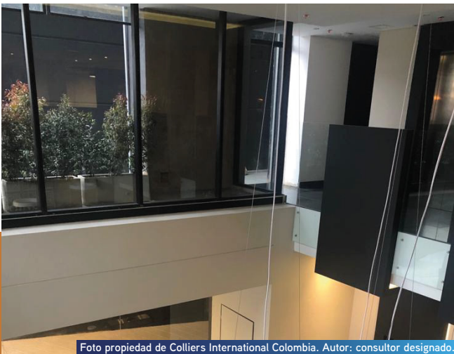
Foto propiedad de Colliers International Colombia. Autor: consultor designado.