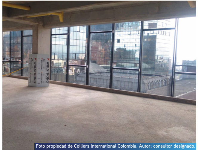
Foto propiedad de Colliers International Colombia. Autor: consultor designado.