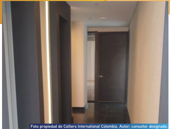
Foto propiedad de Colliers International Colombia. Autor: consultor designado.