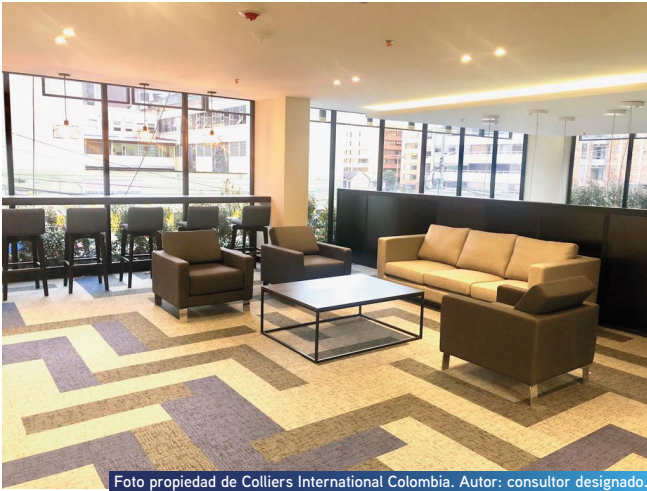
Foto propiedad de Colliers International Colombia. Autor: consultor designado.